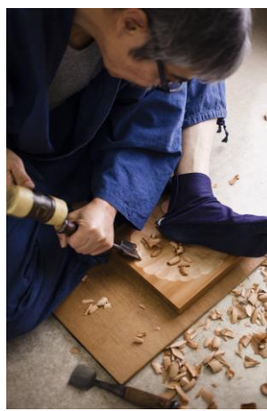
鎌倉彫会館見学(イメージ)