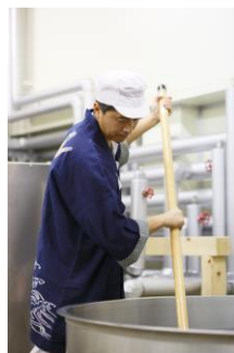
飯沼本家(イメージ)