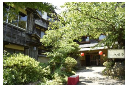
八鶴亭外観(イメージ)