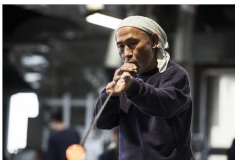
菅原工芸硝子(イメージ)

行程:浜松町バスターミナル(9:00 発)=菅原工芸硝子(ウェルカムシャンパン・見学)=八鶴亭(昼食・ワンドリンク付)=飯沼本家(酒造見学)=成田山新勝寺(参拝・自由散策)=東京駅(18:10 着予定)