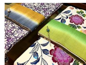
上:鎌倉彫(イメージ)