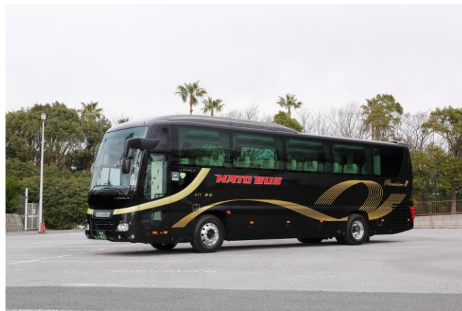
ピアノシモⅢ(イメージ)

今後も「ピアノシモⅢ」で運行するツアーを新たに発売し、1月～6月累計450名様のご利用を目指します。