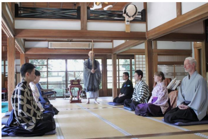
座禅体験(イメージ)

行程:新宿駅東口(8:10 発)=鎌倉彫会館(見学)=せいた呉服店(見学)=帰源院(昼食・座禅体験・居合切見学)=高德院(見学)=新宿駅西口経由=東京駅(18:15 着予定)