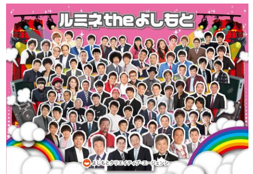
ルミネ the よしもと(イメージ)

(スペイン料理の昼食/お笑いミニライブ)=花園神社(多くの芸能人が奉納する境内の芸能浅間神社など参拝)=ルミネ the よしもと(入場解散)