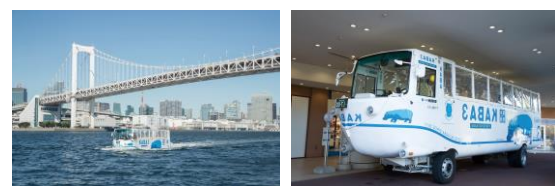
TOKYO NO KABA 水上・陸上(イメージ)

行程:東京駅丸の内南口(9:30発)=TOKYO NO KABA(アクアシティお台場発着/水陸両用バス乗車)・お台場(自由散策)=お台場大観覧車(乗車)=東京ベイ東急ホテル「コーラルテーブル」(ブッフェの昼食)=イクスピアリ(自由散策)=東京駅丸の内南口(16:40頃着)