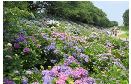
権現堂公園 4月頃(イメージ) このすハッピースクエア 5月頃(イメージ) 権現堂公園 6月頃(イメージ)