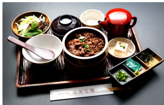
【茨城】夕食(イメージ)