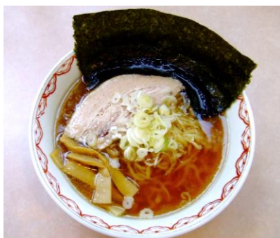
【栃木】昼食(イメージ)