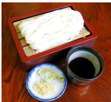
【群馬】朝食(イメージ)

行程:浜松町(8:00 出発)＝東北道＝まゆ玉うどんもり陣(ご当地ツルシコまゆ玉うどん&ナマズ天麩羅の朝食)…茂林寺(拝観)＝マルウチ食品(佐野らーめんの昼食)＝新生姜ミュージアム(見学、新生姜の試食付)＝旅の駅結城つむぎセンター(ショッピング、干し芋の試食付)＝筑波山 ひたち野(常陸牛しぐれ煮ひつまぶしの夕食)＝東京駅(19:00 到着予定)