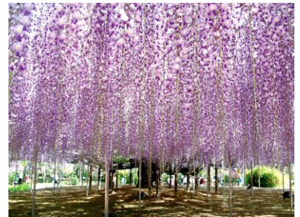
ひたち海浜公園 4月頃(イメージ)