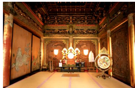
日光東照宮 将軍着座の間(イメージ)